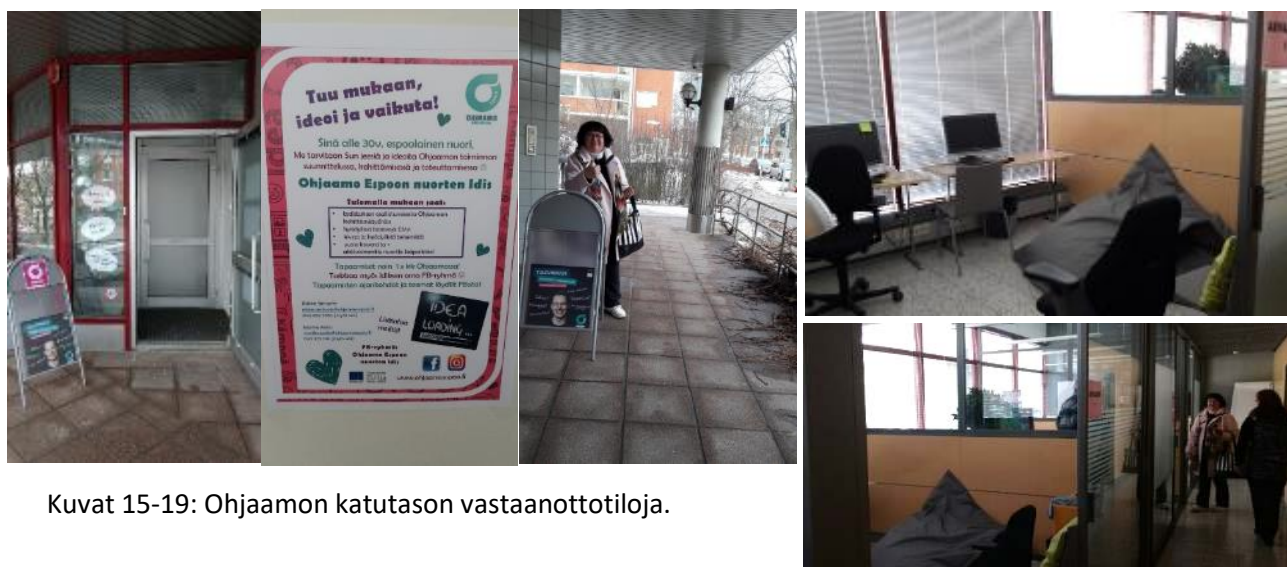
Kuvat 15-19: Ohjaamon katutasen vastaanottotiloja.

Palautekeskustelu käynneistä: maanantai 22.5 klo 10 – 12