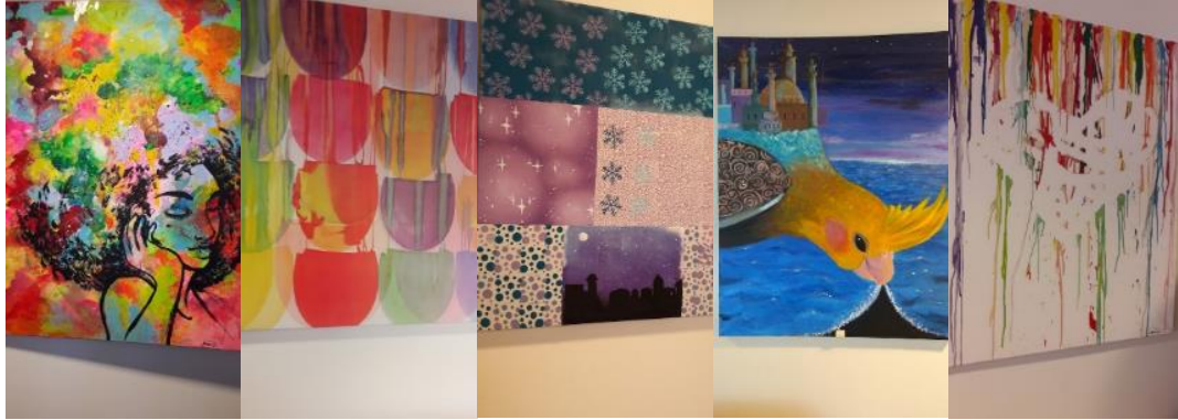
Kuvat 6-10. Nuorten tekemää taidetta Ohjaamon seinällä.

kostosta muodostuu neljä eri tiimiä (vastaanotto, hyvinvointi, kouluttautuminen ja työllistyminen), joihin on nimetty tiiminvetäjät. Espoon matalankynnyksen palvelut esittäytyy NUORI2017-tapahtumassa Tampereella 27.-29.3.2017.