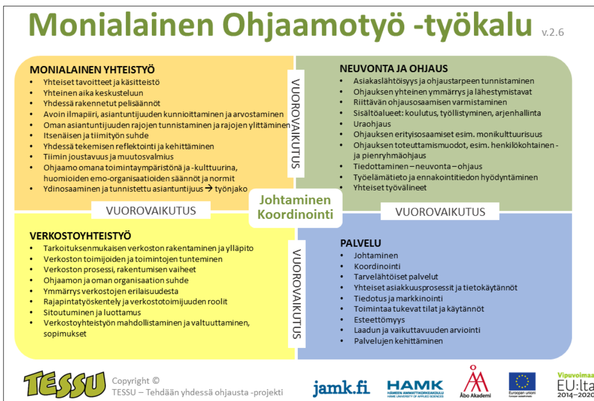
Kuva 1: Verkostomainen yhteistyöosaaminen

Keskustelujen pohjana käytetään alla olevaa Monialainen Ohjaamotyö -nelikenttää (kuva 1), jossa kuvataan monialaisen yhteistyön, yhdessä tekemisen ja verkostotyön elementtejä. Nelikenttä on holistinen kuvaus siitä, minkälaista erilaista osaamista Ohjaamoissa tulee olla, kun puhutaan monialaisesta ja -amatillisesta ohjauspalvelusta. Monialainen ja -amatillinen yhteistyöosaaminen sisältävät ajatuksen verkostomaisesta toimintatavasta. Kuvion avulla ohjaamotoimijat pystyvät jäsentämään ja käsitteellistämään omaa toimintaansa ja se auttaa ohjaamotoimijoita näkemään monialaisen yhdessä tekemisen kokonaisuuden.