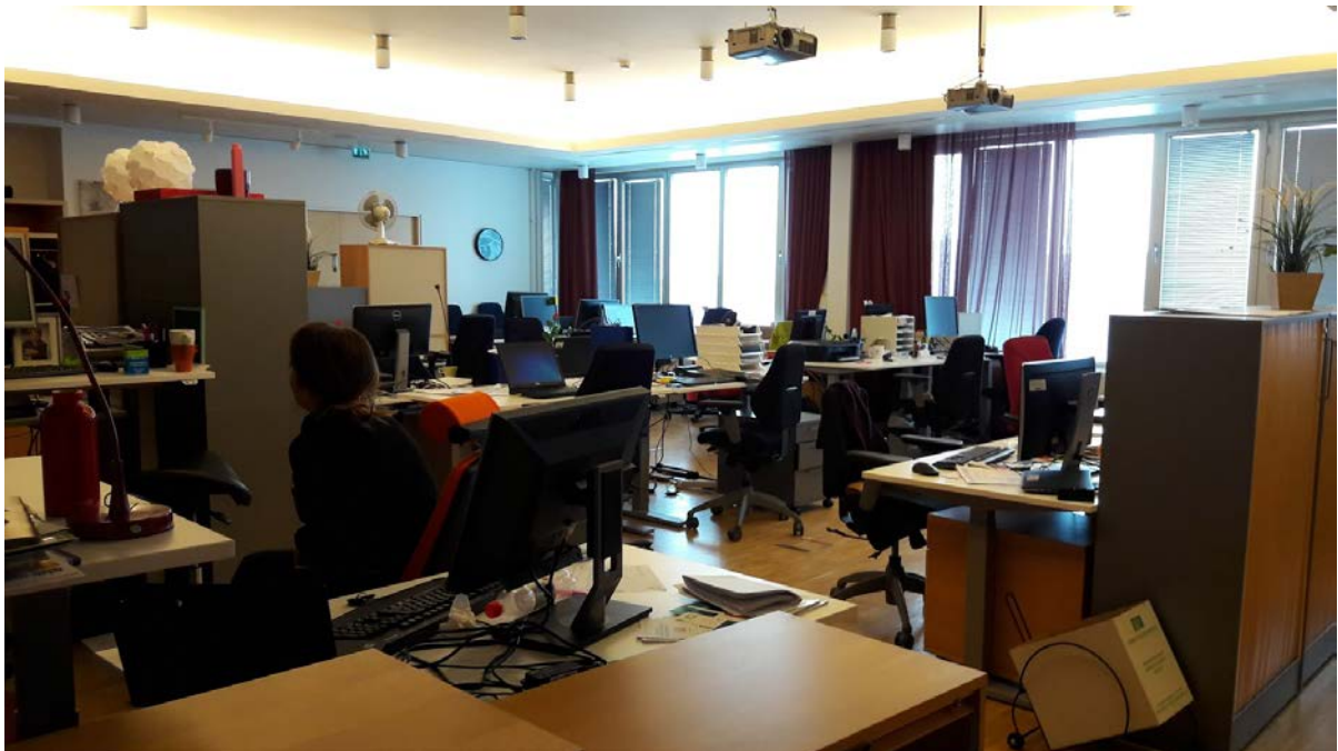
Kuva 3. Ohjaamo Espoon asiantuntijoiden työskentelytila.

Ohjaamotoimintaa kehittää Ohjaamo Espoo -projekti (ESR), joka on Omnian hallinnoima hanke, ja jota rahoittavat Keski-Suomen ELY-keskus, Espoon kaupunki sekä Helsingin Diakonissalaitos. Ohjaamo sijaitsee Espoon Leppävaarassa osoitteessa Lintuvaarantie 2, johon se muutti 27.2.2017 Espoon keskustan Kamreerintieltä.