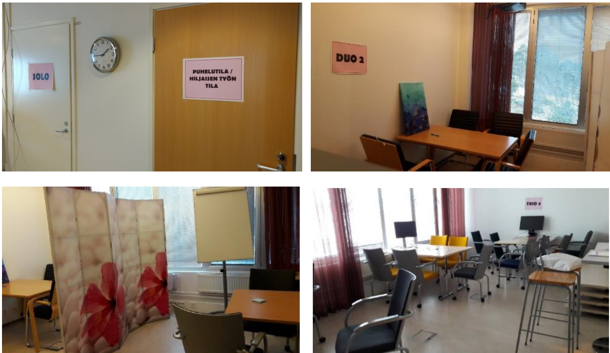
Kuvat 11-14. Ohjaamon työskentelytiloja.